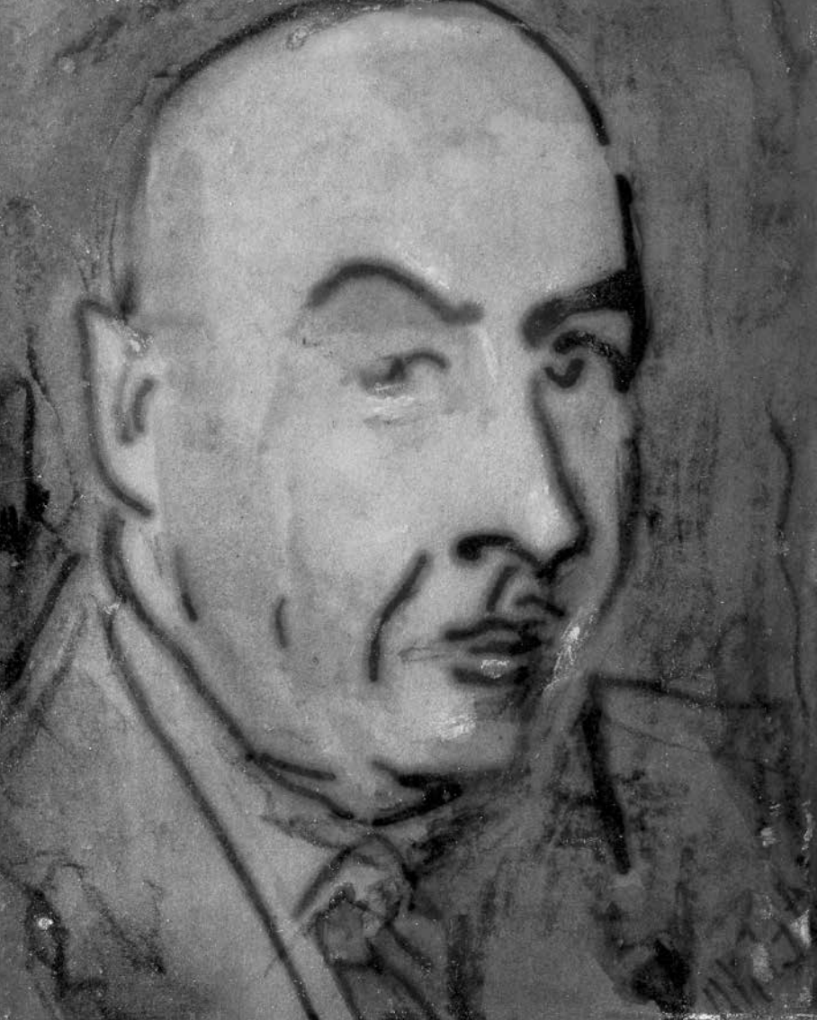
Autoritratto, per Cesare Zavattini