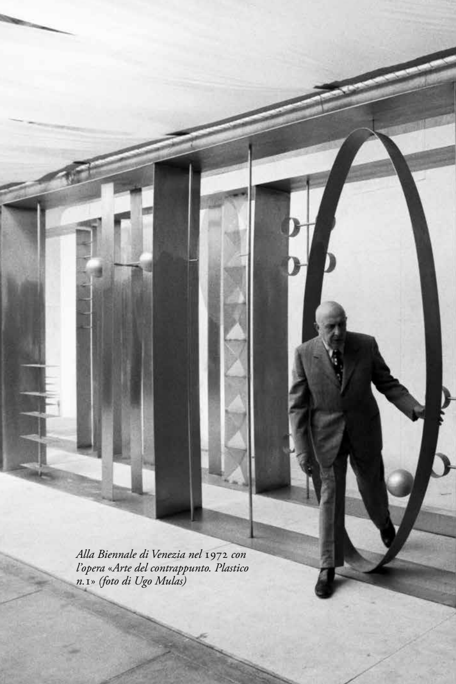
Alla Biennale di Venezia nel 1972 con l'opera «Arte del contrappunto. Plastico n.1»